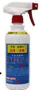
スプレー装着時の写真